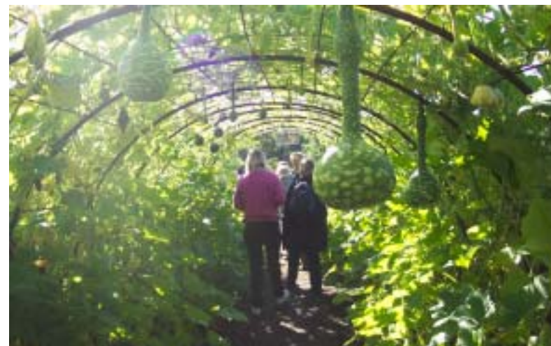
Förskolornas miljöombud får inspiration på Ulriksdals handelsträdgård.