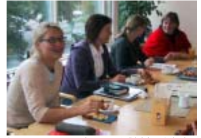
Lärarna grupperarbetar på Riddar Jakob.

Trots att tobaksbruket har minskat i Sverige börjar fortfarande cirka 25 000 ungdomar att röka varje år. I slutet av september samlades 40 lärare på restaurang Riddar Jakob för att utbildas i hur tobaksfrågorna kan integreras i skolans ordinarie undervisning, hur skolan kan utveckla en policy och hur skolan kan förbättra föräldrasamverkan kring dessa frågor. Utbildningen är en del i ett regeringsfinansierat tobakspreventionsprojekt som Järfälla kommun deltar i.